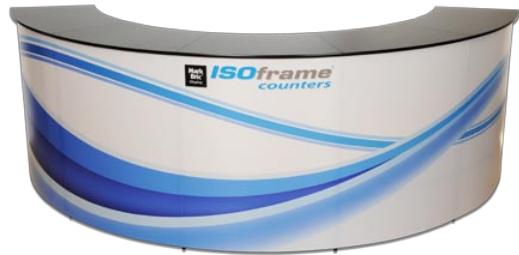
5-Sektionen Theke, 4100(B) x 495(T)x1050(H) mm